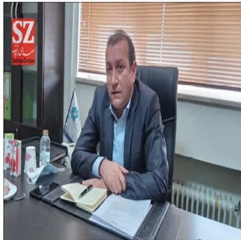
رئیس اتحادیه صادرکنندگان استان زنجان در جلسه با مدیران استانه

کاهش ۲۱ درصدی صادرات استان زنجان | ۱۳۰۲/۱۲/۱۷ پنجشنبه | (0) | (0) | (0)