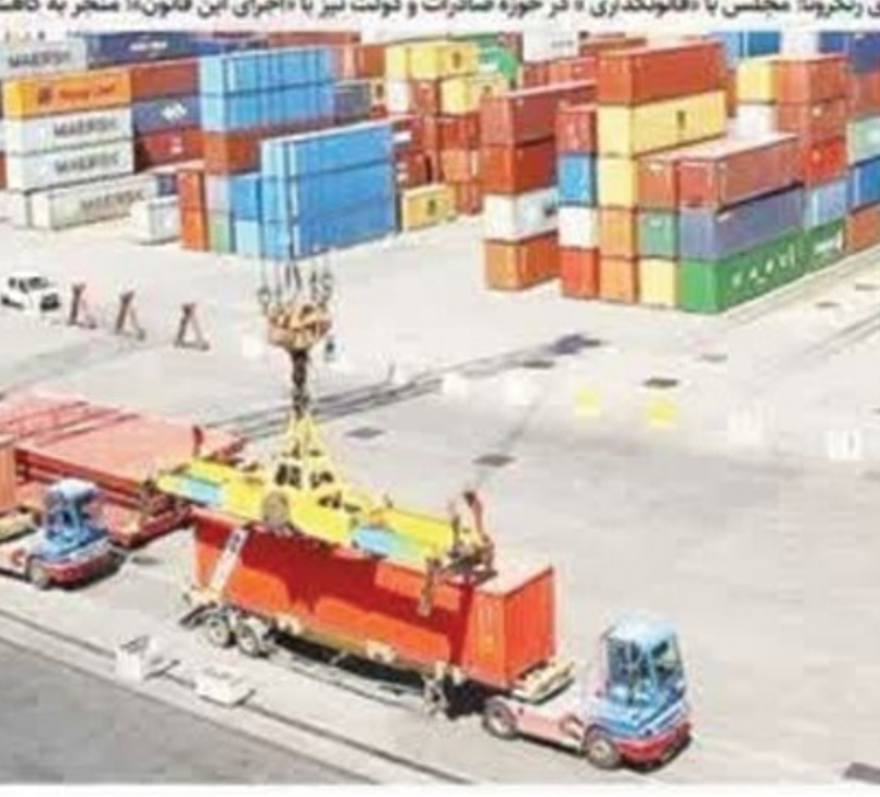
منطقه صادراتی استان زنجان

انتخابات خاتمه مطبوعات زنجان به زودی برگزار خواهد شد